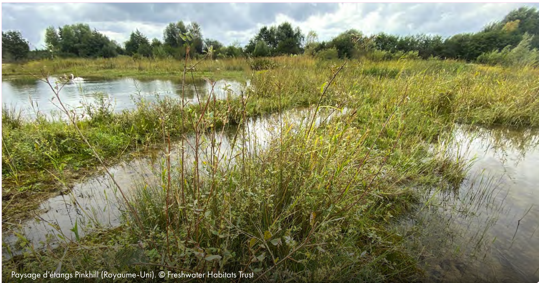
Paysage d'étangs Pinkhill (Royaume-Uni).

L'inventaire du financement durable de PONDERFUL dans le manuel technique de PONDERFUL identifie 24 « instruments de financement » différents que les gestionnaires de paysages d'étangs peuvent utiliser pour financer la gestion, la restauration ou la création des étangs, y compris : des mesures génératrices de revenus pour le gouvernement ou les propriétaires privés, des subventions publiques et des dons, des dons privés, des emprunts, des investissements et des approches contractuelles.