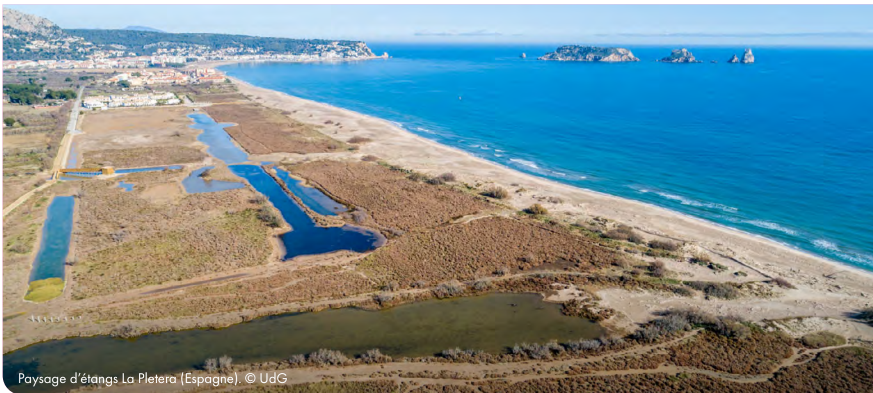
Paysage d'étangs La Pletera (Espagne).

La proposition de « Convention sur la protection des étangs » fournit des suggestions précieuses aux décideurs politiques concernés par la gestion des terres et de l'eau.